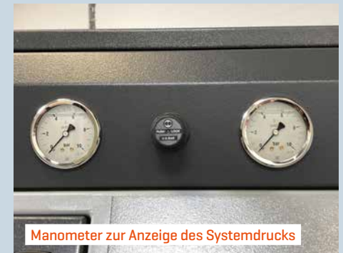
Manometer zur Anzeige des Systemdrucks