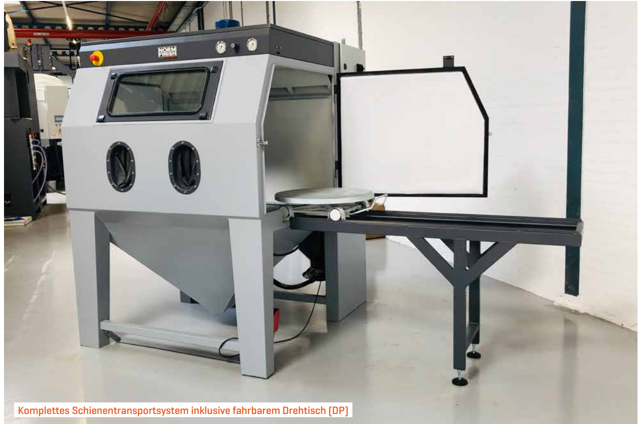
Komplettes Schienentransportsystem inklusive fahrbarem Drehtisch [DP]