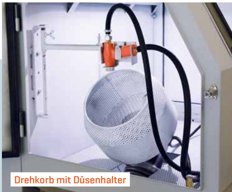
Drehkorb mit Düsenhalter