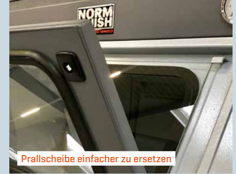
Prallscheibe einfacher zu ersetzen