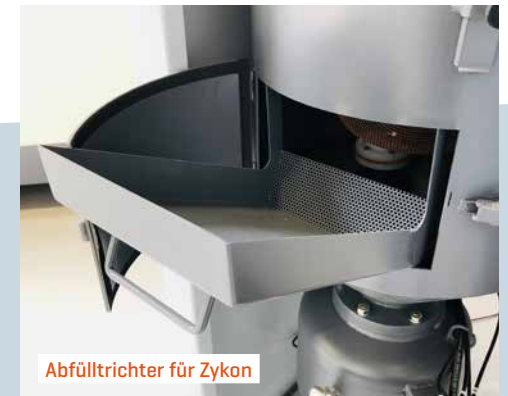
Abfülltrichter für Zykon